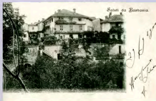
La casa natale di Bernardino Drovetti in una cartolina di fine ottocento

Georgio Francisco et Annae Vittoriae Parentibus amatissimis Eques Bernardinus Michael Drovetti Hoc pietatis monumentum Posuit ANNO MDCCCXXXII