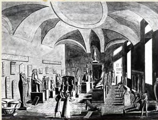
M. Nicolosino - Prima disposizione della Collezione Drovettiana nell'ala sinistra del Palazzo dell'Accademia delle Scienze, 1824.

L'impero ottomano ha ripreso il potere, ma è afflitto da disordini interni. La flotta inglese con l'ammiraglio Nelson, intende conquistare l'Egitto. In questo periodo emerge la figura di Mohamed Ali, un giovane militare macedone giunto in Egitto per combattere l'invasione napoleonica a fianco degli inglesi.