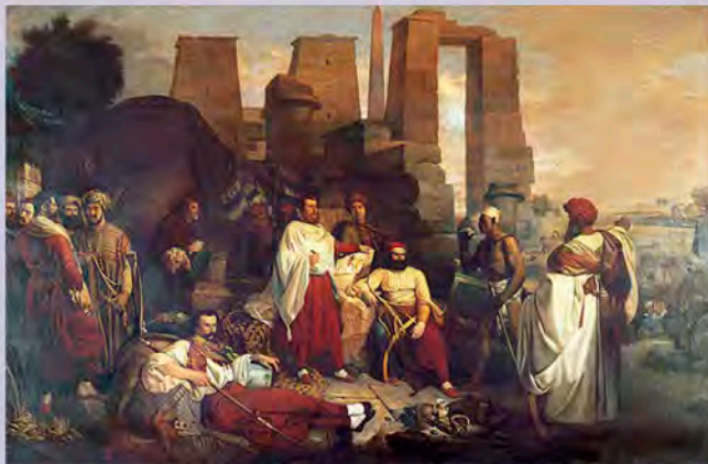
Jean François Champollion seduto al centro. Sullo sfondo il tempio di Luxor.

Contemporaneamente, Jean François Champollion arriva a Torino: ha scoperto, studiando la Pietra di Rosetta, la chiave di lettura dei geroglifici, ma cerca documenti per completarne la lettura. Nella nostra città trova l'appoggio dell'Accademia delle Scienze e i reperti del nascente Museo Egizio. Finalmente le statue hanno un nome e una storia, i papiri rivelano i loro contenuti.